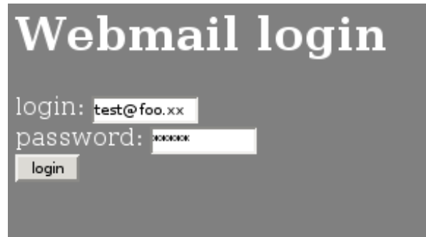
Figura 5: login

pagina di login della webmail vista con Mozilla e il codice sorgente della stessa pagina (con Mozilla lo si vede con Ctrl-U, figura 5).